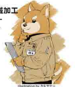
Illustration by カキヤク