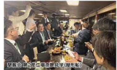
懇親会(第2部工場夜間見学(屋形船))

第58回大都市青年経営者交流研究大会が川崎市産業振興会館にて行われ、各都市の方々と交流を深めました。