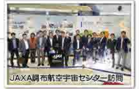
JAXA調布航空宇宙センター訪問