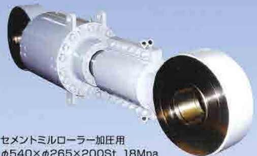
セメントミルローラー加圧用 φ540×φ265×200St, 18Mpa