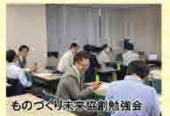
ものづくり未来協創勉強会