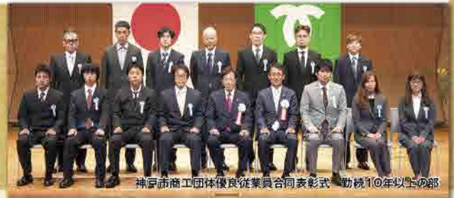
神戸市商工団体優良従業員合同表彰式 勤続10年以上の部