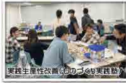
実践生産性改善(ものづくり実践塾)