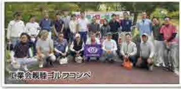
工業会親睦ゴルフコンペ