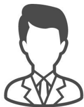
参画経営者 (イメージ)